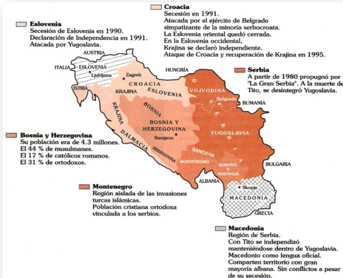
MAPA 9. La fragmentación de Yugoslavia

su fragmentación. El muro de Berlín fue derrumbado, y Alemania procedió a la reunificación. Once repúblicas rusas formaron la Comunidad de Estados Independientes y Estonia, Lituania, Letonia y Georgia se independizaron.