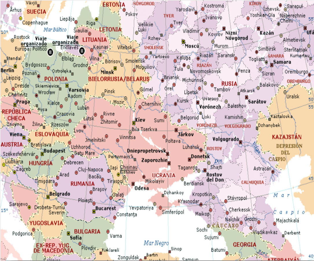
Mapa 10. Europa y Asia después de la caída del socialismo