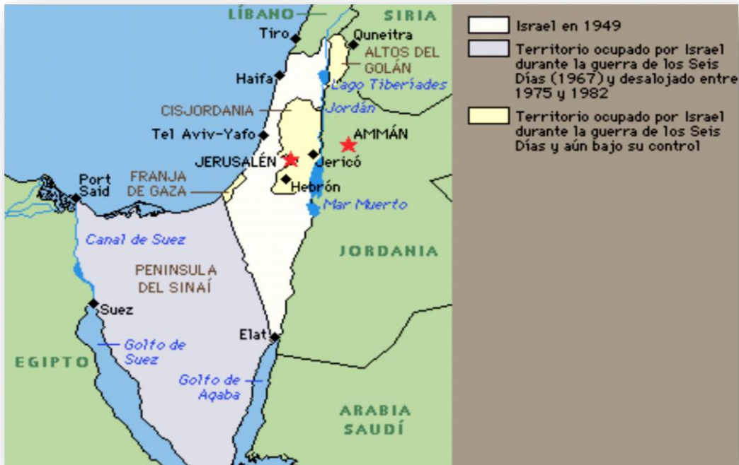
MAPA 8. Palestina. Territorios ocupados

Por otro lado, la mediatización de Egipto invitó a otros países de la zona a luchar entre sí por la hegemonía de la zona. Entre 1980 y 1988 se enfrentaron en una cruenta guerra Irak contra Irán y en 1991, la Guerra del Golfo cambió a los protagonistas.